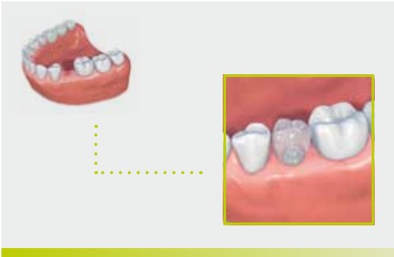
Ersatz eines einzelnen Zahns im Seitenbereich mit einer implantatgestützten Krone.

Das Zahnimplantat ersetzt die fehlende Zahnwurzel und dient als Träger für die Implantatkrone. Die gesunden Nachbarzähne müssen nicht beschliffen werden, und die gesunde Zahnschubstanz bleibt erhalten.