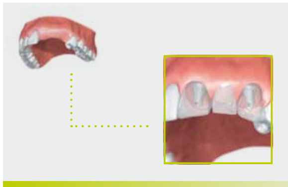
Ersatz mehrerer Zähne im Frontbereich mit einer implantatgestützten Brücke.