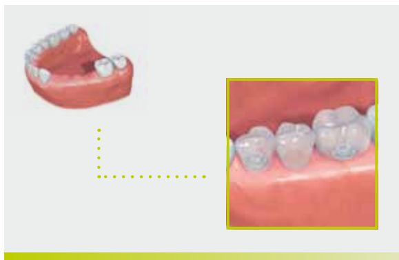
Ersatz mehrerer Zähne im Seitenbereich mit einer implantatgestützten Brücke.