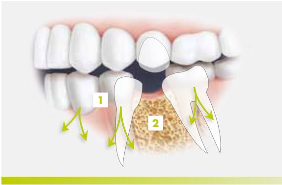
Auswirkung fehlender Zähne auf den Kieferknochen.

Bei einem gesunden Zahn überträgt die Wurzel Kaukräfte auf die Kieferknochen. Der Zahn bleibt stabil und in der Regel unverändert (1). Wenn ein oder mehrere Zähne fehlen, treten diese Kräfte nicht mehr auf, so dass es zu einem Abbau des Kieferknochens kommen kann (2). Ein Zahnimplantat kann dabei helfen, den langsamen Knochenschwund zu verhindern, da es die natürliche Zahn-