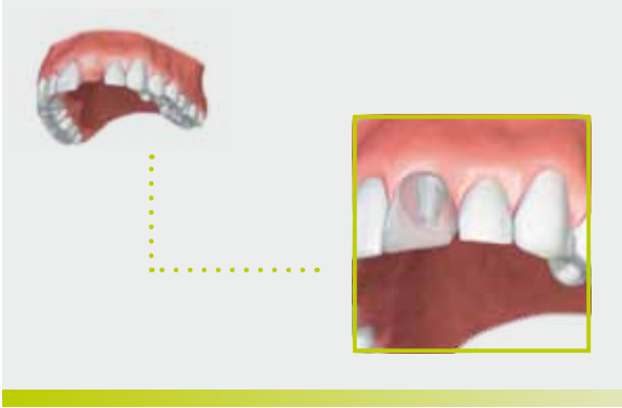
Ersatz eines einzelnen Zahns im Frontbereich mit einer implantatgestützten Krone.